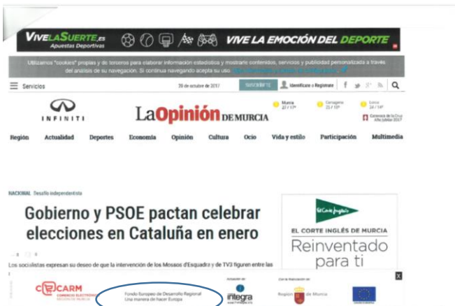
Banners en prensa regional

https://www.alcantarilla.es/el-alcalde-de-alcantarilla-joaquin-buendia-y-el-director-general-de-simplificacion-de-la-actividad-empresarial-y-economia-digital-francisco-abril-asisten-al-inicio-de-uno-de-los-talleres-del/